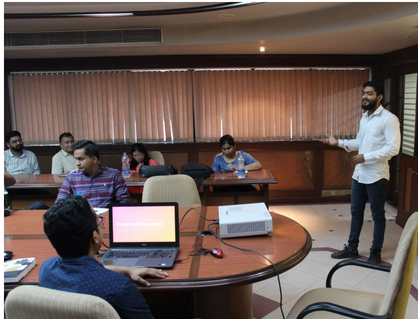
Introduction to Open Source workshop • Vadodara, India 2019