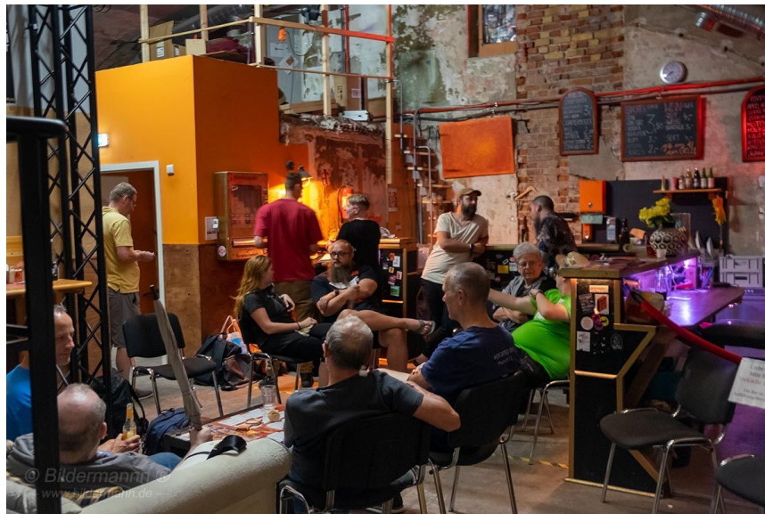
WC Leipzig 2023