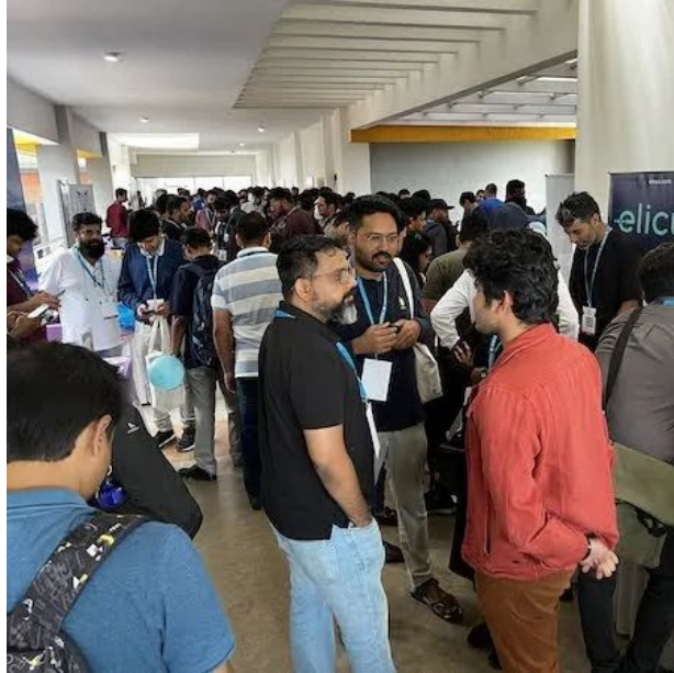
WC Bengaluru 2023