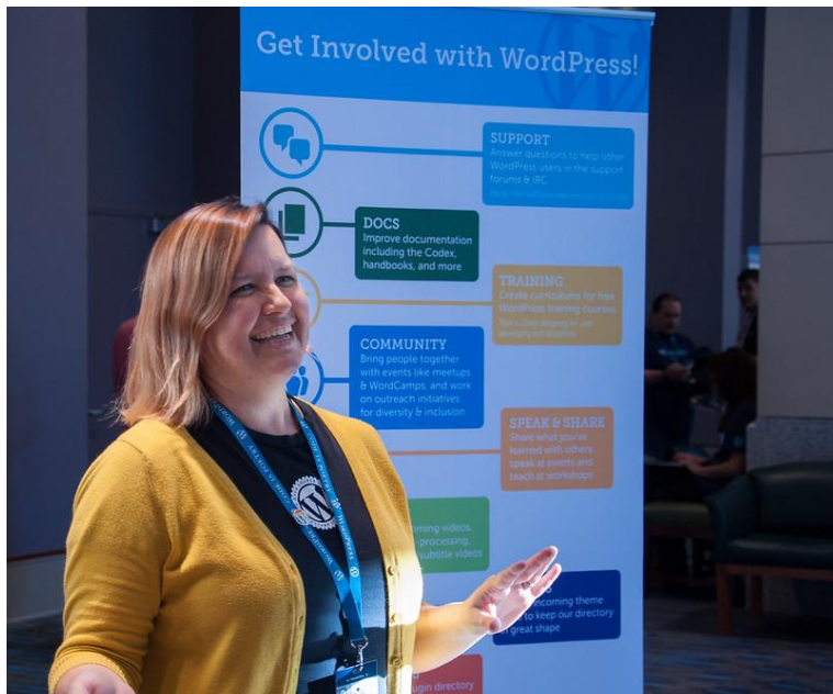
Get Involved table at WCUS 2015