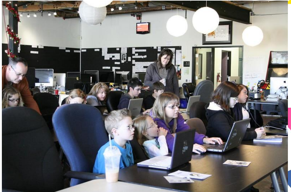
WordCamp Phoenix 2011