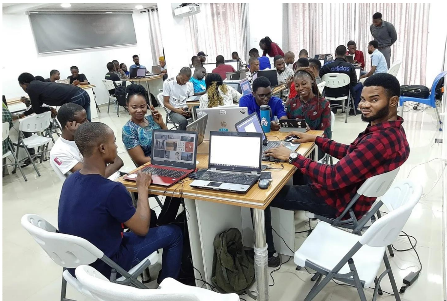
do_action Lagos 2019